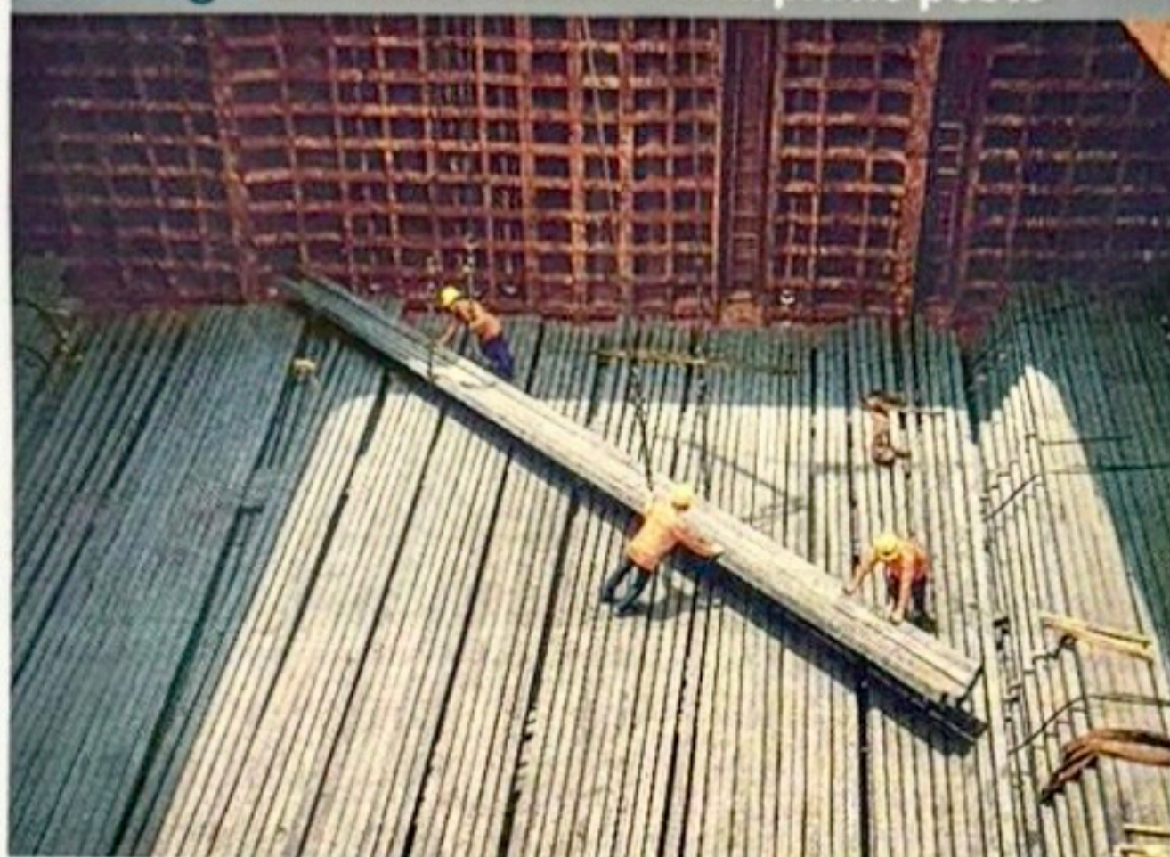
L'analisi il dato del calo delle esportazioni è stato diffuso ieri dal Centro Studi di Siderweb